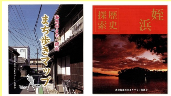
▲改訂された「まち歩きマップ」