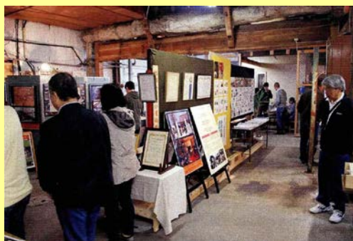
▲「みそ蔵ギャラリー」の様子