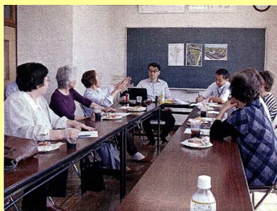
↑ 商業施設のコンセプト作成の様子