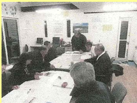
→ 産業再生検討会議の様子