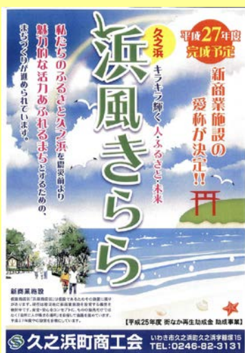
→ 作成された 商業施設PRチラシ