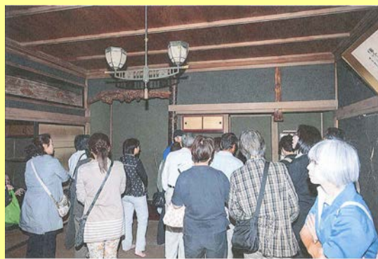
← 離れ屋敷の一般公開の様子